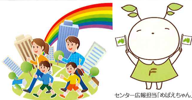
センター広報担当「めばえちゃん」